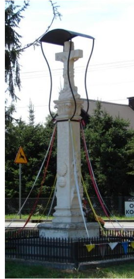
Barokowe kapliczki z Kozłowa, Gręboszowa i Borusowej