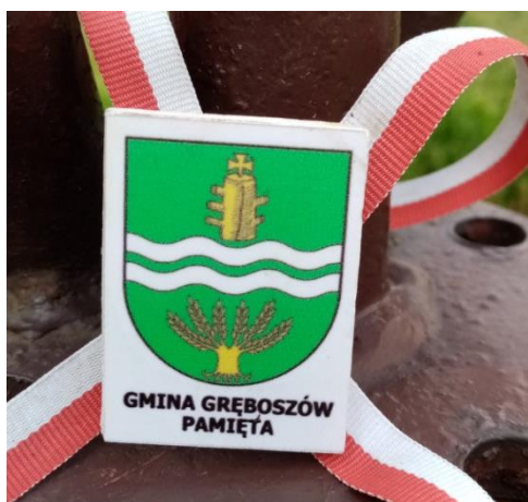
Pamiątkowa tabliczka na Pomniku Grunwaldzkim w Gręboszowie

Dla zachowania dziedzictwa kulturowego i pamięci historycznej istotne są także inne działania podejmowane przez Gminę, jak chociażby umieszczanie pamiątkowych zawieszek na pomnikach.