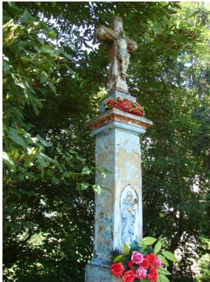
Kapliczki malowane w kwiaty „typu zalipiańskiego”