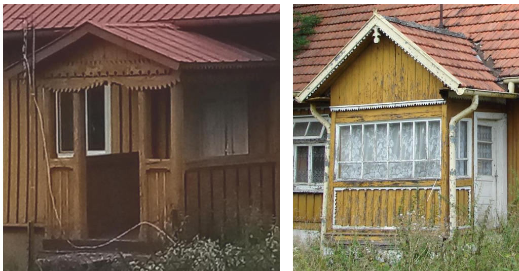
Przykłady ganków w Gręboszowie i Ujściu Jezuickim

Niektóre domy posiadają zabudowane mniej lub bardziej ganki oraz inne detale architektoniczne. Oprócz drewnianych domów na uwagę zasługują murowane domy wybudowane zapewne w okresie międzywojennym, które są również tradycyjnym elementem krajobrazu kulturowego i świadectwem przemian jakie zaczęły zachodzić na początku XX wieku.