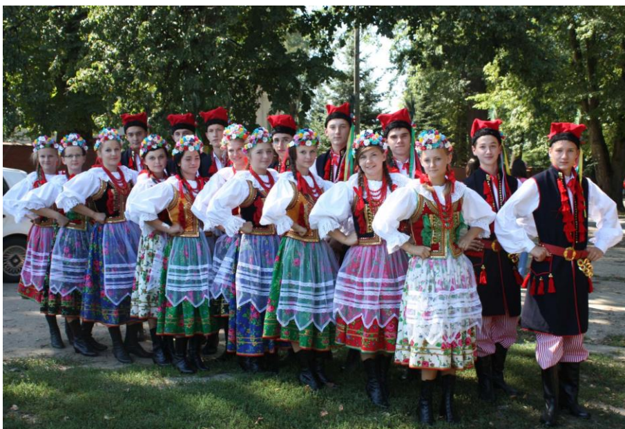
Zespół Pieśni i Tańca Ziemi Gręboszowskiej

Na terenie gminy działa Gminne Centrum Kultury i Czytelnictwa im. Jakuba Bojki, które swoje zadania publiczne wykonuje poprzez „rozpoznawanie, rozbudzenie zainteresowań i potrzeb kulturalnych środowiska, tworzenie warunków rozwoju amatorskiego ruchu artystycznego, kształtowanie wzorów aktywnego uczestnictwa w kulturze, gromadzenie, dokumentowanie, ochronę i udostępnianie dóbr kultury, edukację kulturalną oraz popularyzację wiedzy, sztuki i książki, upowszechnianie czytelnictwa, promocję Gminy Gręboszów, kultywowanie lokalnych tradycji, organizowanie imprez rekreacyjno-sportowych i rozrywkowych” itp. W ramach GCK działa Zespół Pieśni i Tańca Ziemi Gręboszowskiej, Zespół Impresjon, Kafejka Internetowa. Przez cały rok organizowane są pokazy, konkursy i koncerty, festyny, turnieje a nawet wakacyjne kino plenerowe. Co roku organizowany jest konkurs na najładniejszą palmę Wielkanocą. Gmina bierze również udział w zewnętrznych konkursach.