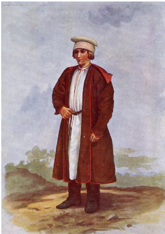
Ubiór chłopski spod Dąbrowy Tarnowskiej ( www.strojeludowe.net )

W ujęciu etnograficznym gmina Gręboszów należy do regionu Krakowiaków Wschodnich. Męski strój ludowy Krakowiaków Wschodnich to biała lniana koszula, proste spodnie z płótna lnianego w pionowe, najczęściej biało-czerwone paski, pas, buty, kaftan bez rękawów lub z rękawami, sukmana i rogatywka. Ubiór kobiety charakteryzował się wielością odmian i wariantów. Inaczej ubierano się w okolicach Pińczowa, Skalmierza, Miechowa, Brzeska czy Dąbrowy Tarnowskiej. Ubiór składał się następujących elementów: chusta czepcowa (dla mężatki) lub chustka, koszula oraz często stanowiąca jej uzupełnienie oddzielna kryzka, spódnice wierzchnia i spodnia (fartuchy), zapaska, gorset, kaftan (katana), obuwie i korale.