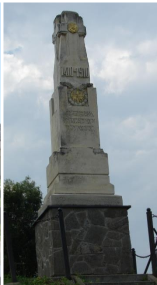
Pomniki w Żelichowie, Woli Żelichowskiej i Gręboszowie