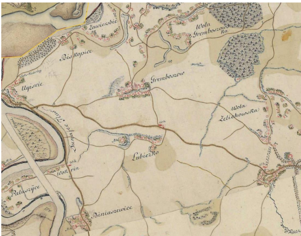
Niektóre miejscowości gminy Gręboszów na Mapie Galicji i Lodomerii z lat 1779-1783 ( https://maps.arcanum.com/en/map/firstsurvey-galicia/ )

Typowa zabudowa wsi to ulicówka. Domy skupione są wzdłuż głównej osi (drogi), która często przebiega zgodnie z ukształtowaniem terenu, np. meandrami rzek i starorzeczami. Domy zazwyczaj stoją frontem do drogi, rzadziej szczytem. Wsie o średniowieczne metryce takie jak Gręboszów, Lubiczko, Bieniaszowice, Żelichów, Wola Żelichowska (sięgające swoimi początkami XIII wieku) usytuowane są na wydmach, niewielkich wzniesieniach, ponad poziomem zalewowym rzek, między ich meandrami i starorzeczami. Jeszcze w wieku XVIII i XIX taka lokacja była bardzo czytelna na mapach oraz widoczna na rycinach. Ukształtowanie sieci dróg i miejscowości na terenie gminy jest konsekwencją ukształtowania terenu. Taki krajobraz kulturowy zachował się w większości miejscowości z terenu gminy.