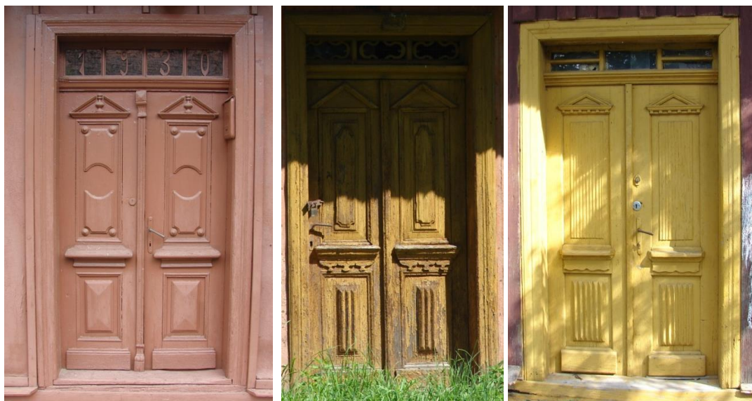
Przykłady drewnianych drzwi z Gręboszowa, Woli Żelichowskiej i Bieniaszowic

zakończenia belek stropowych pod okapem (tzw. „rysie”). Wyjątkowo cenne i stanowiące często o wartościach zabytkowych chałup są drewniane drzwi, płycinowe, zdobiono dodatkowo dekoracjami architektonicznymi.