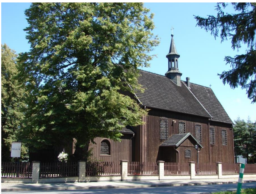
Kościół parafialny w Żelichowie

Charakterystyczne dla krajobrazu gminy Gręboszów są różnorodne kapliczki, figury i krzyże przydrożne. Najstarsze są datowane na 1 połowę XVIII wieku, a pozostałe na wiek XIX i XX. Można wyróżnić kilka zasadniczych typów tych obiektów zabytkowych. Najstarsze i najbardziej cenne są barokowe, kamienne krzyże lub figury świętych na kolumnach (słupach), wykonane najczęściej z jasnego piaskowca, z bogatą symboliką katolicką, postaciami świętych i inskrypcjami (Borusowa, Kozłów, Gręboszów). Do kolejnej grupy zaliczyć można kamienne figury Matki Bożej na cokole, datowane na drugą połowę XIX wieku oraz pierwszą połowę XX wieku. Około połowy wieku XX wieku pojawiają się na cokole również postacie Chrystusa lub św. Józefa. Tego typu kapliczki są opracowane kolorystycznie, zarówno w obrębie cokołu, jak i przedstawianej postaci. W dwóch przypadkach na kapliczkach w Borusowej zauważono malowane kwiaty. Jest to dość nowa tradycja ludowa rozprzestrzeniająca się z niedalekiego Żalipia. Kolejnym typem kapliczek przydrożnych są metalowe lub drewniane krzyże (Karsy, Zawierzbie, Gręboszów), chociaż tych jest znacznie mniej. Zaobserwowano na terenie gminy, że tradycja stawiania kapliczek nie należy bynajmniej do przeszłości, ponieważ pojawiają się nowe, o dużych walorach artystycznych. Kolejnym typem przydrożnych kapliczek są tzw. kapliczki domkowe znajdujące się w Woli Żelichowskiej, Biskupicach, Ujściu Jezuickim (murowane) oraz w Kozłowie (drewniana).