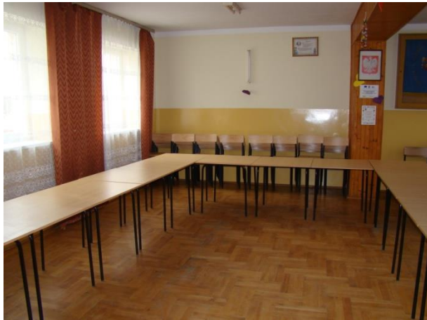
Pomieszczenie sali szkoleniowej przed remontem