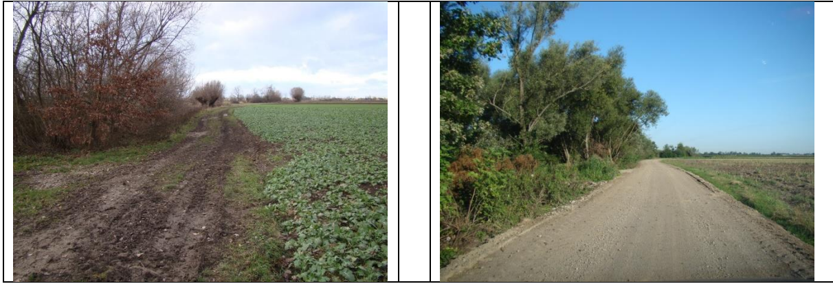
Fot. Nr 2 Widok drogi dojazdowej do gruntów rolnych w km \sim 0+700 ( z lewej przed modernizacją, z prawej po modernizacji)