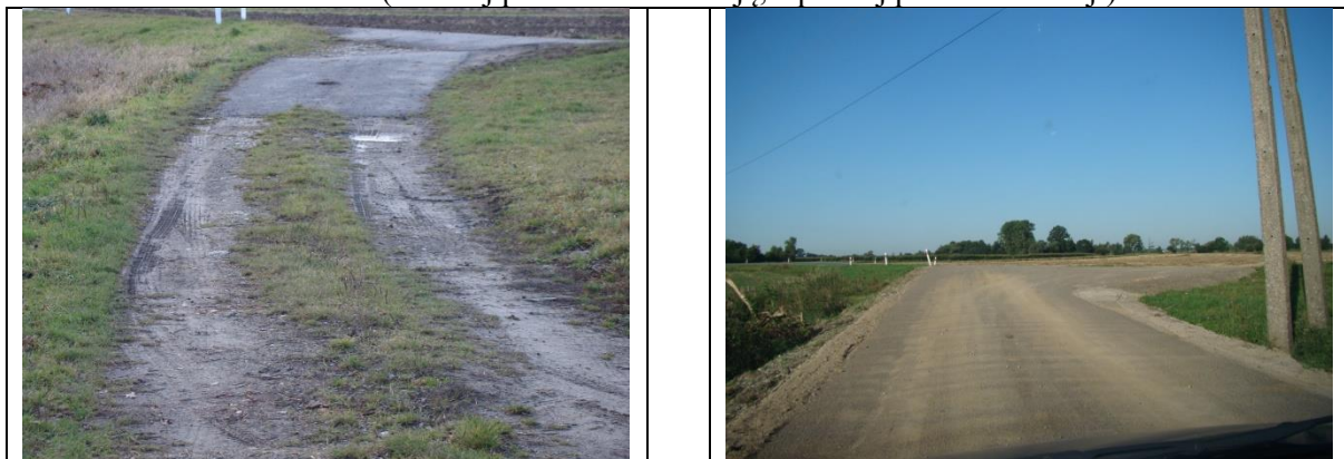
Fot. Nr 7 Widok drogi dojazdowej do gruntów rolnych – koniec modernizacji drogi w km 1+907 ( z lewej przed modernizacją, z prawej po modernizacji)

Długość ścieżek rowerowych na dzień 1 stycznia 2019 r. wynosiła 14,46 km i na koniec roku nie uległa zmianie, a był to odcinek Wiślanej Trasy Rowerowej (Bieniaszowice – Hubenice) będącej we władaniu Zarządu Dróg Wojewódzkich w Krakowie.