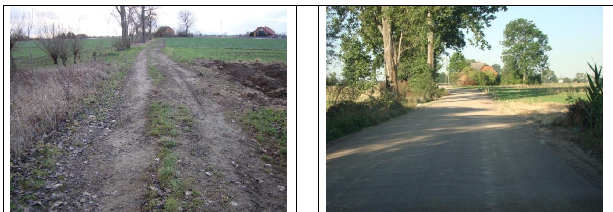
Fot. Nr 6 Widok drogi dojazdowej do gruntów rolnych – koniec modernizacji drogi w km ~ 1+600 ( z lewej przed modernizacją, z prawej po modernizacji)