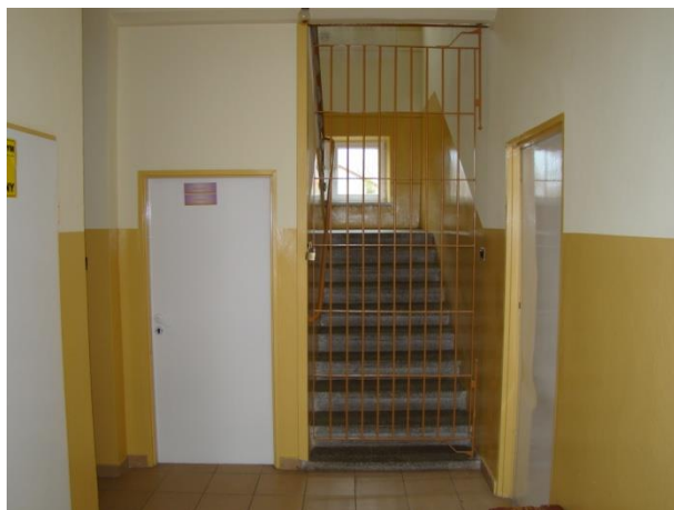
Klatka schodowa przed remontem