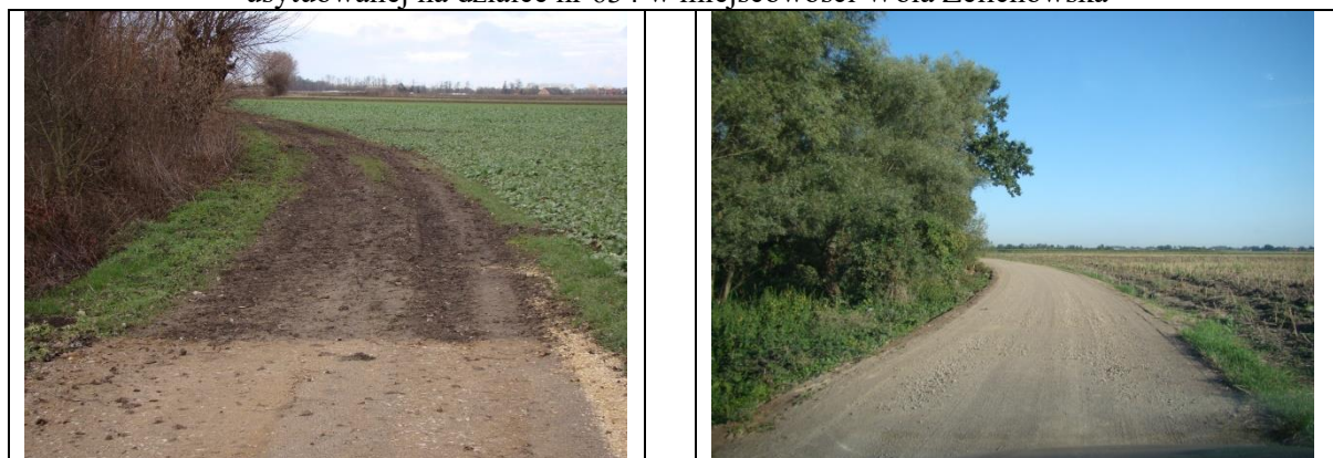
Fot. Nr 1 Widok drogi dojazdowej do gruntów rolnych – początek modernizacji drogi w km 0+600 (z lewej przed modernizacją, z prawej po modernizacji)

Dokumentacja fotograficzna ilustrująca miejsce wykonanego przedsięwzięcia – modernizacji drogi dojazdowej do gruntów rolnych w 2019 r. usytuowanej na działce nr 634 w miejscowości Wola Żelichowska