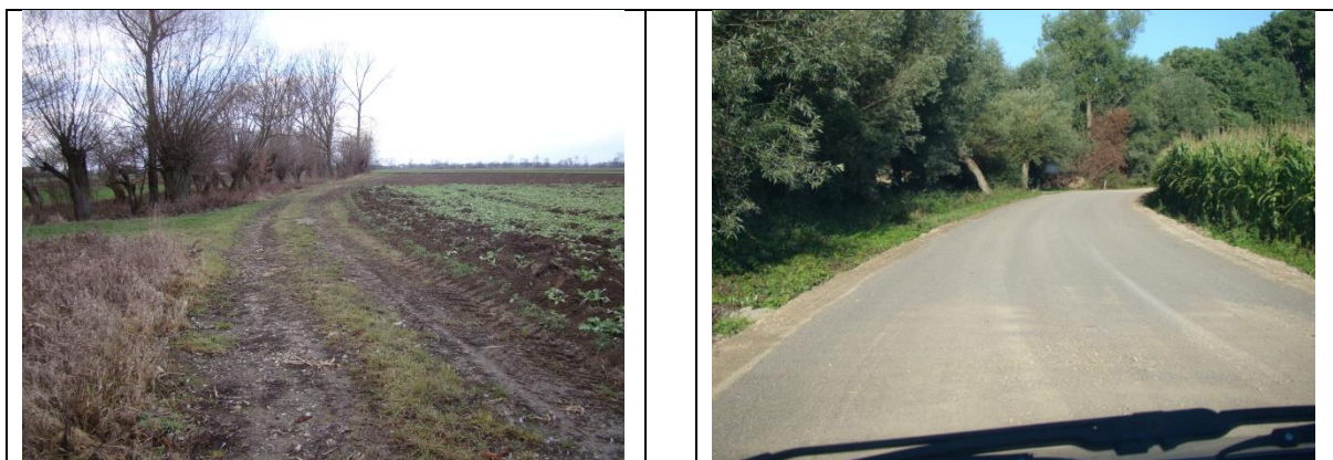
Fot. Nr 5 Widok drogi dojazdowej do gruntów rolnych w km ~ 1+500 ( z lewej przed modernizacją, z prawej po modernizacji)