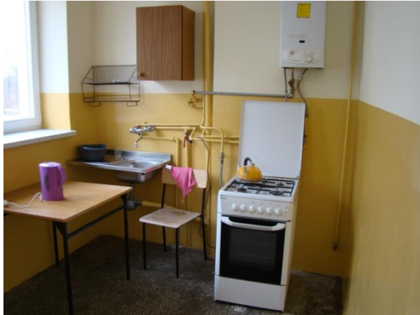
Pomieszczenie socjalne przed remontem