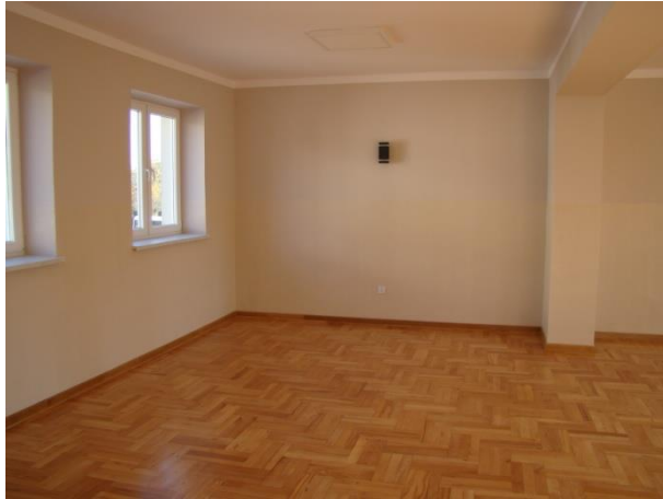
Pomieszczenie sali szkoleniowej po remoncie

Długość czynnej sieci wodociągowej na początku 2019 roku wynosiła 74,60 km i nie zmieniła się w ciągu roku. Ilość przyłączy wodociągowych wynosiła 770 szt. i w ciągu roku wzrosła do 802 szt. (+32) i przedstawiała się następująco: