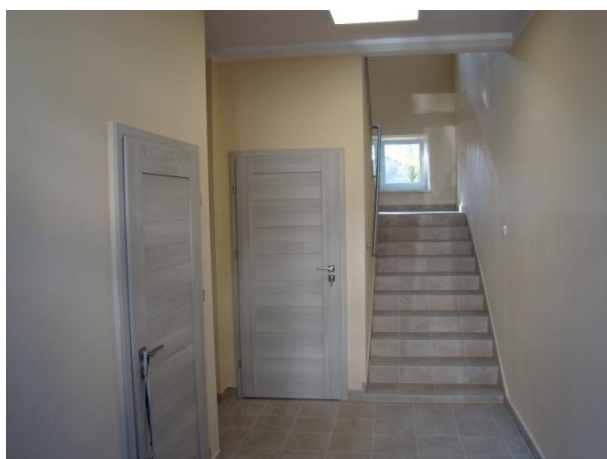
Klatka schodowa po remoncie