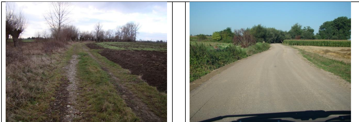
Fot. Nr 4 Widok drogi dojazdowej do gruntów rolnych w km \sim 1+300 ( z lewej przed modernizacją, z prawej po modernizacji)