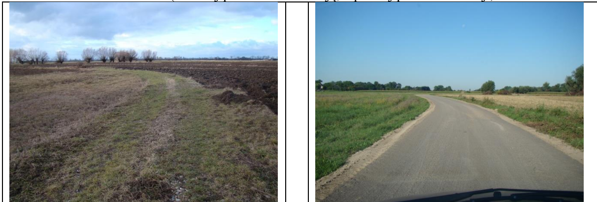
Fot. Nr 3 Widok drogi dojazdowej do gruntów rolnych w km \sim 1+000 ( z lewej przed modernizacją, z prawej po modernizacji)