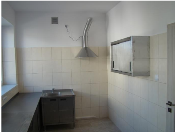
Pomieszczenie socjalne po remoncie